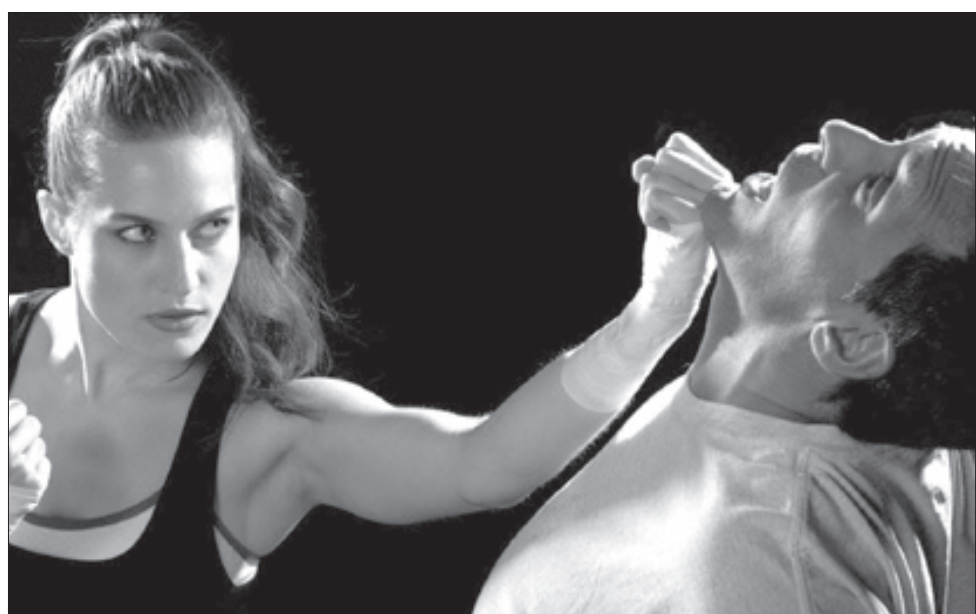
Em um cenário de crescente violência, cada vez mais mulheres têm procurado por técnicas de defesa pessoal

DEFESA PESSOAL x ARTES MARCIAIS PARA MULHERES - Existem modalidades das artes marciais que também treinam aspectos da defesa pessoal. No entanto, o professor pontua que há diferenças e que deve se levar